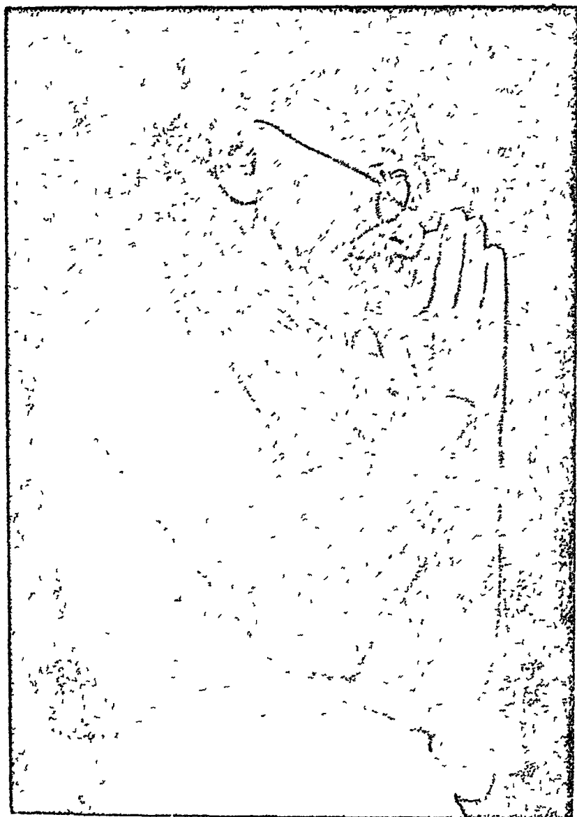
दुनियादी शिक्षा के जन्मदाता बापू